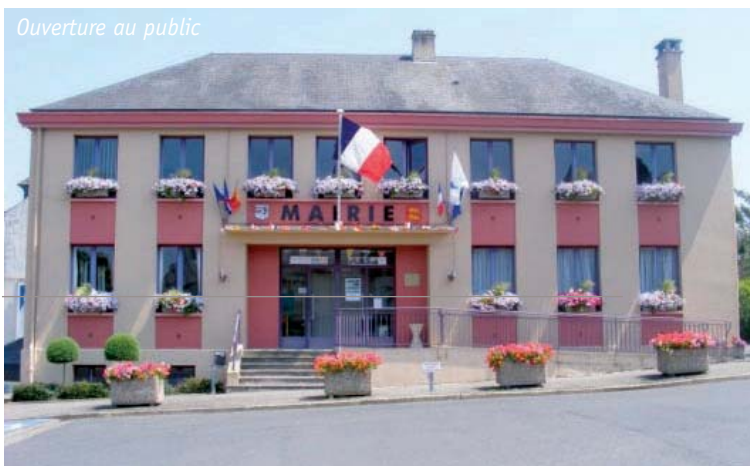
Ouverture au public

Prochains rendez-vous le mercredi 2 juillet de 13h30 à 15h et le vendredi 8 août de 10h30 à 12h au 02.31.15.28.61.